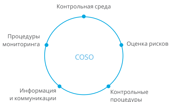
СХЕМА СТРУКТУРЫ СВК

В КМГ и ДЗО внедряется СВК, которая направлена на обеспечение разумной уверенности в достижении целей КМГ в трех ключевых областях: