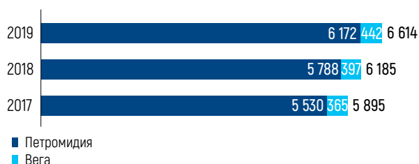
ОБЪЕМЫ ПРОИЗВОДСТВА НЕФТЕПРОДУКТОВ НА ДОЛЮ КМГ, ТЫС. ТОНН

В 2019 году маржа переработки НПЗ «Петромидия», рассчитанная как разница между котировками на сырую нефть сорта Urals и котировками на произведенные нефтепродукты (бензин, дизель, нефть, сжиженный газ, авиатопливо, мазут, пропилен, серу и нефтяной кокс) составила 4,2 долл. США за баррель, что на 2 долл. США за баррель ниже показателя 2018 года (в результате снижения котировок нефти на международном рынке).